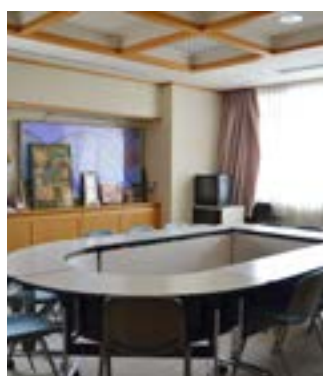
小会議室(ミナスの間)