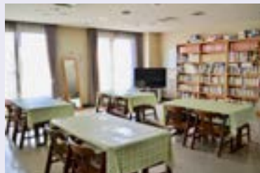
ダイニングルーム (食堂) (3F)