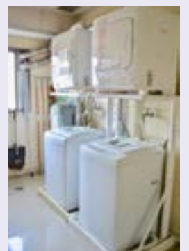
洗濯機 (Washing Machine) が無料で使えます。 (3F、4F)