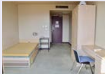
部屋 (3F、4F) Free Wi-Fi