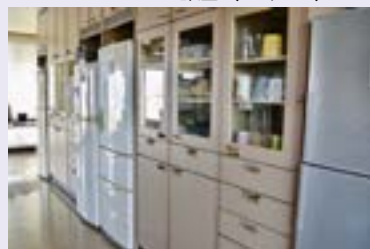
冷蔵庫、なべ、皿などが使えます。(3F)