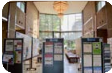
県立国際交流センターロビー