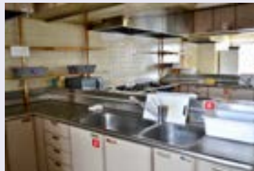
共同キッチン (電子レンジ付き) (3F)