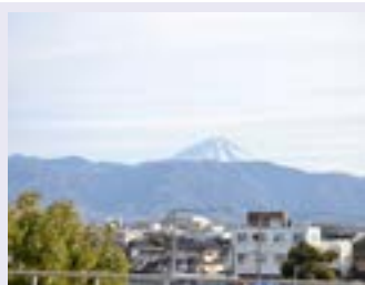
部屋からの富士山 (Mt.Fuji)

住みたい人は、大学や学校の先生にこのチラシを見せて、相談してください。 (公財) 山梨県国際交流協会 Yamanashi International Association Tel. 055-228-5419 e-mail : webmaster@yia.or.jp