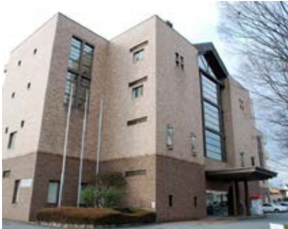
県立国際交流センター (Yamanashi International Center) 場所：甲府市飯田 2-2-3