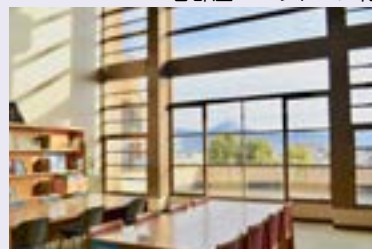
学習スペース (3F) 富士山をながめながら！