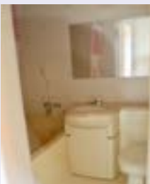
各部屋ユニットバス付