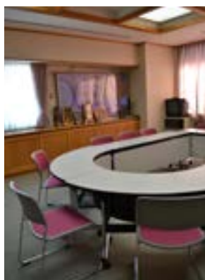
小会議室(ミナスの間)