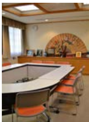
小会議室(四川の間)